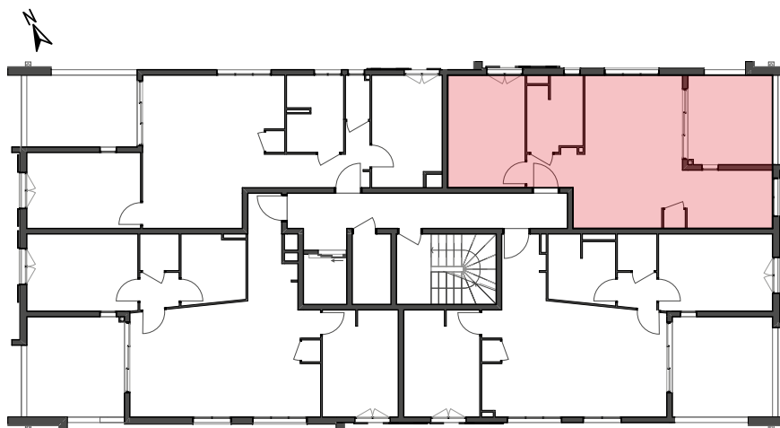
Plan de repérage