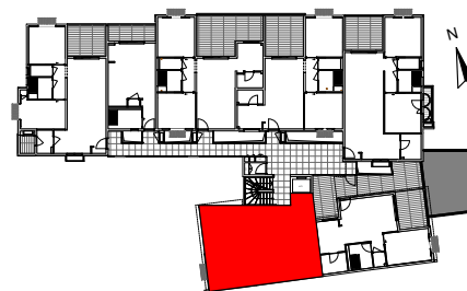
PLAN DE REPERAGE