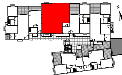
PLAN DE REPERAGE