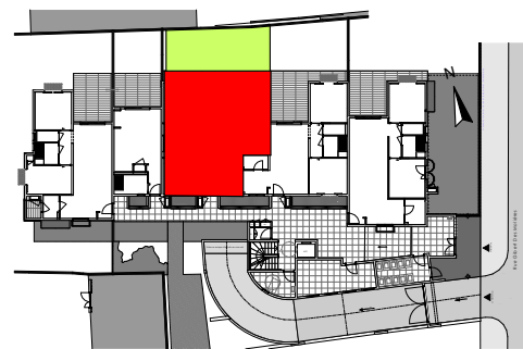
PLAN DE REPERGE