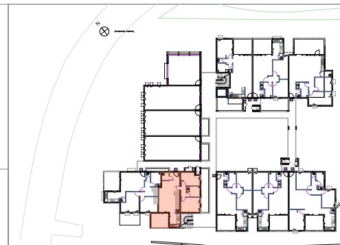
PLAN DE REPERAGE