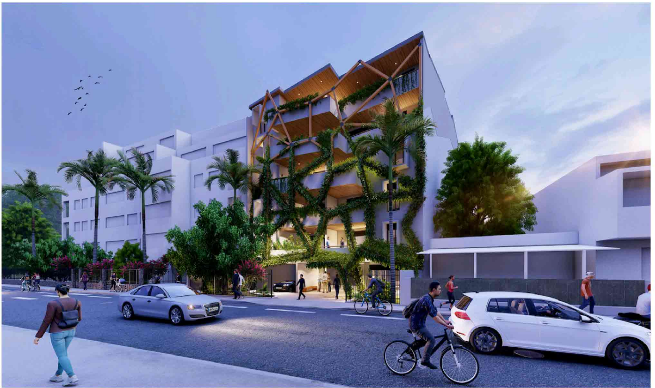
Vue depuis la rue du Général De Gaulle à Saint Denis