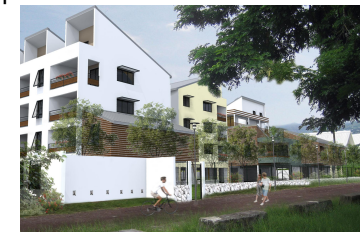
Commune de Saint Paul