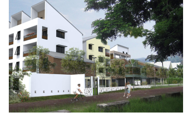
Commune de Saint Paul