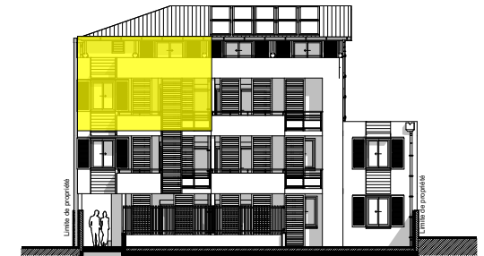
Façade Est Bât B2