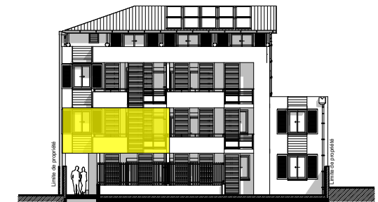
Façade Est Bât B2