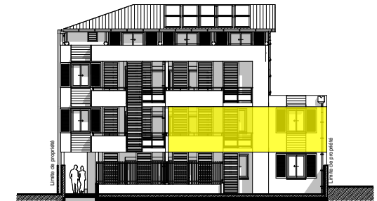
Façade Est Bât B2