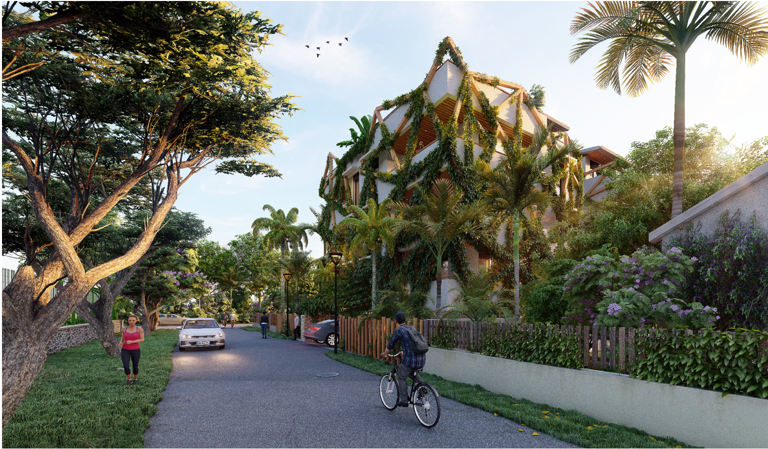
Vue depuis les terrains de tennis à l'Etang-Salé les Bains