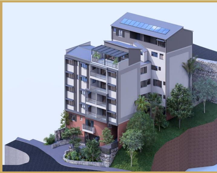
Perspective aérienne — Vue d'ensemble du programme