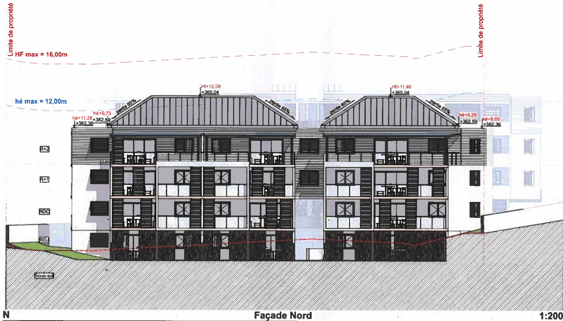
Façade Nord Façade en pied de bâtiment