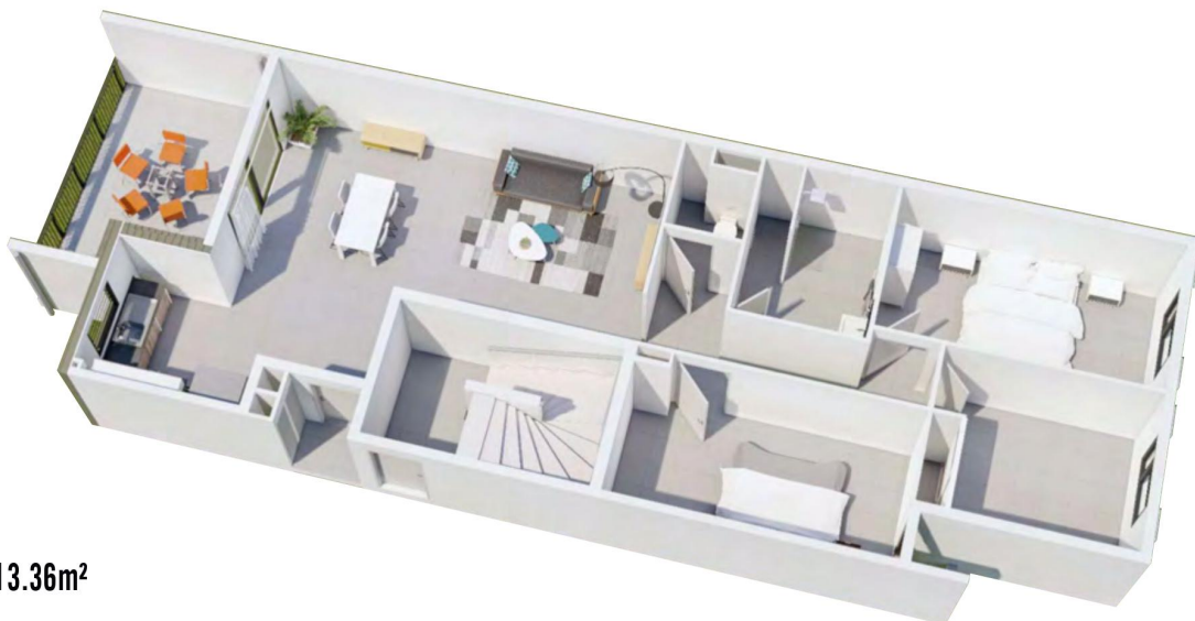
Type T4 - 113.36m 2

La haute qualité des matériaux est ici un gage de luxe, carrelage de grand module finition béton ciré, carrelage sur tous les murs des pièces d'eau, robinetterie et appareillage électrique de grande marque design... Cuisine aménagée...