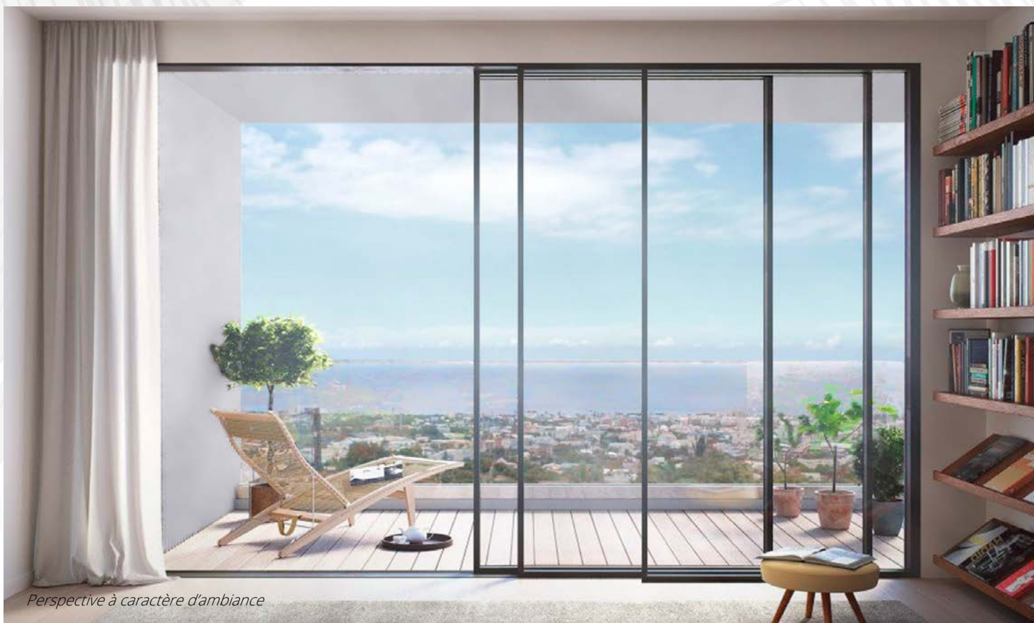
Perspective à caractère d'ambiance