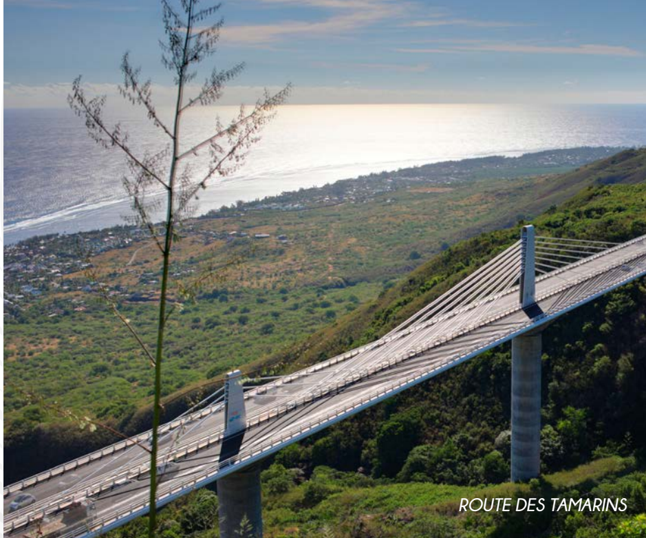
ROUTE DES TAMARINS

L'accès direct au boulevard Sud vous permet de vous rendre aisément aux plages et aux différentes villes de l'île. L'arrêt de bus « Framboisiers » à 200m de CASTEL ROC vous permet d'opter pour les circulations douces.