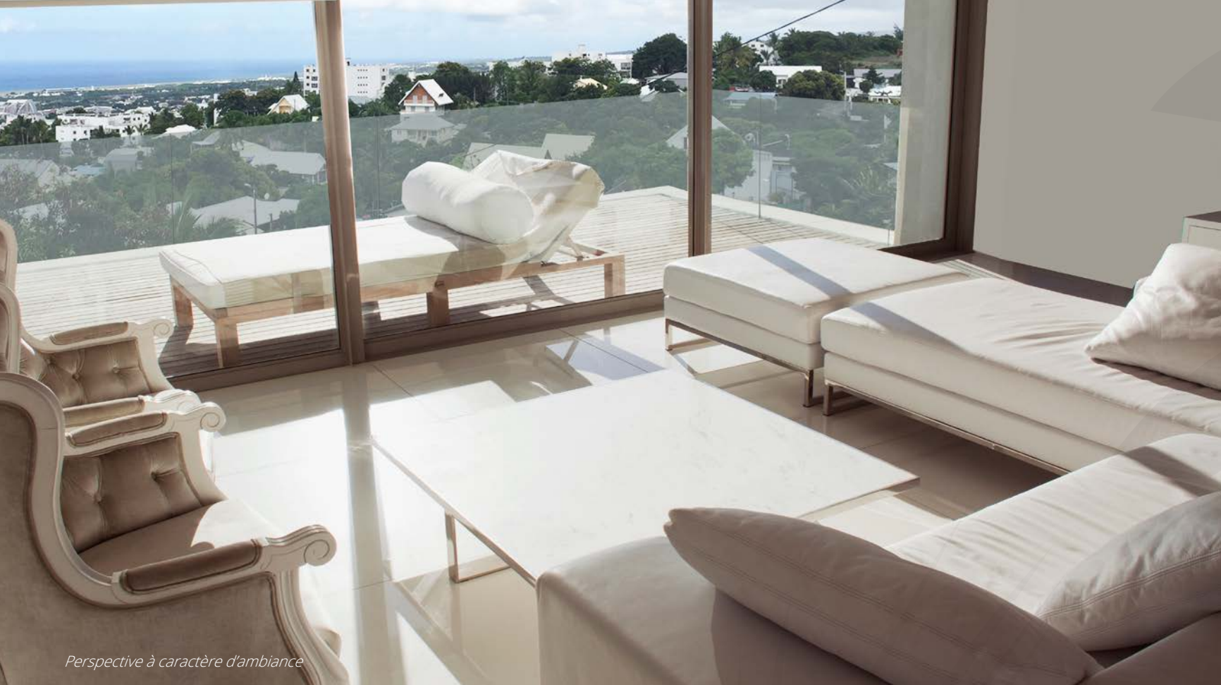
Perspective à caractère d'ambiance