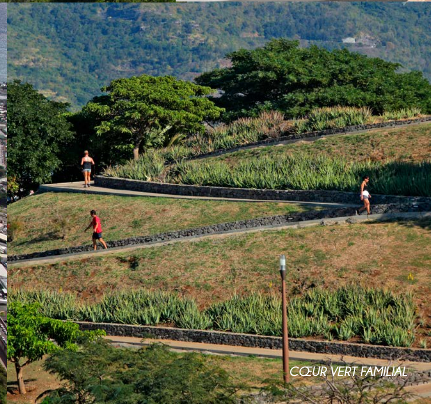
CŒUR VERT FAMILIAL