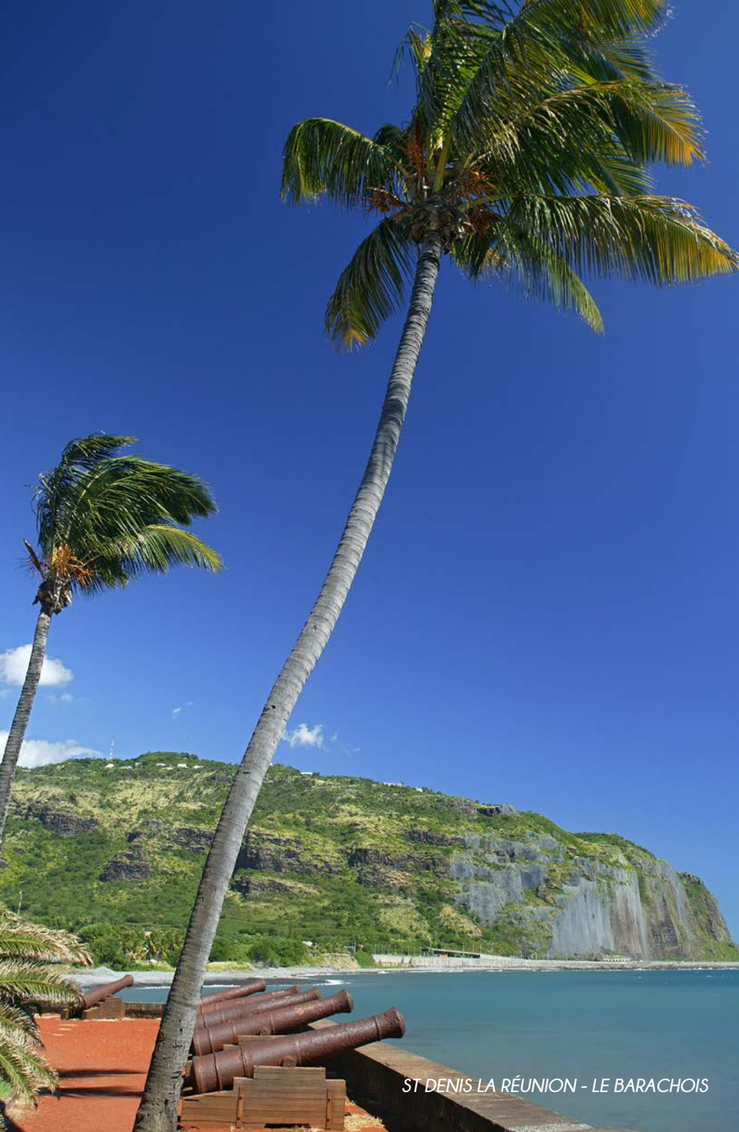
ST DENIS LA RÉUNION - LE BARACHOIS