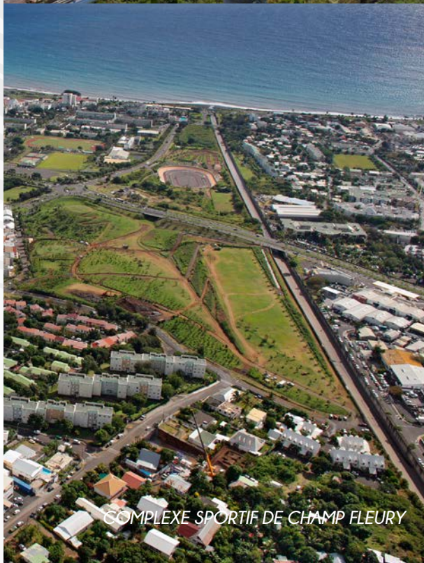
COMPLEXE SPORTIF DE CHAMP FLEURY