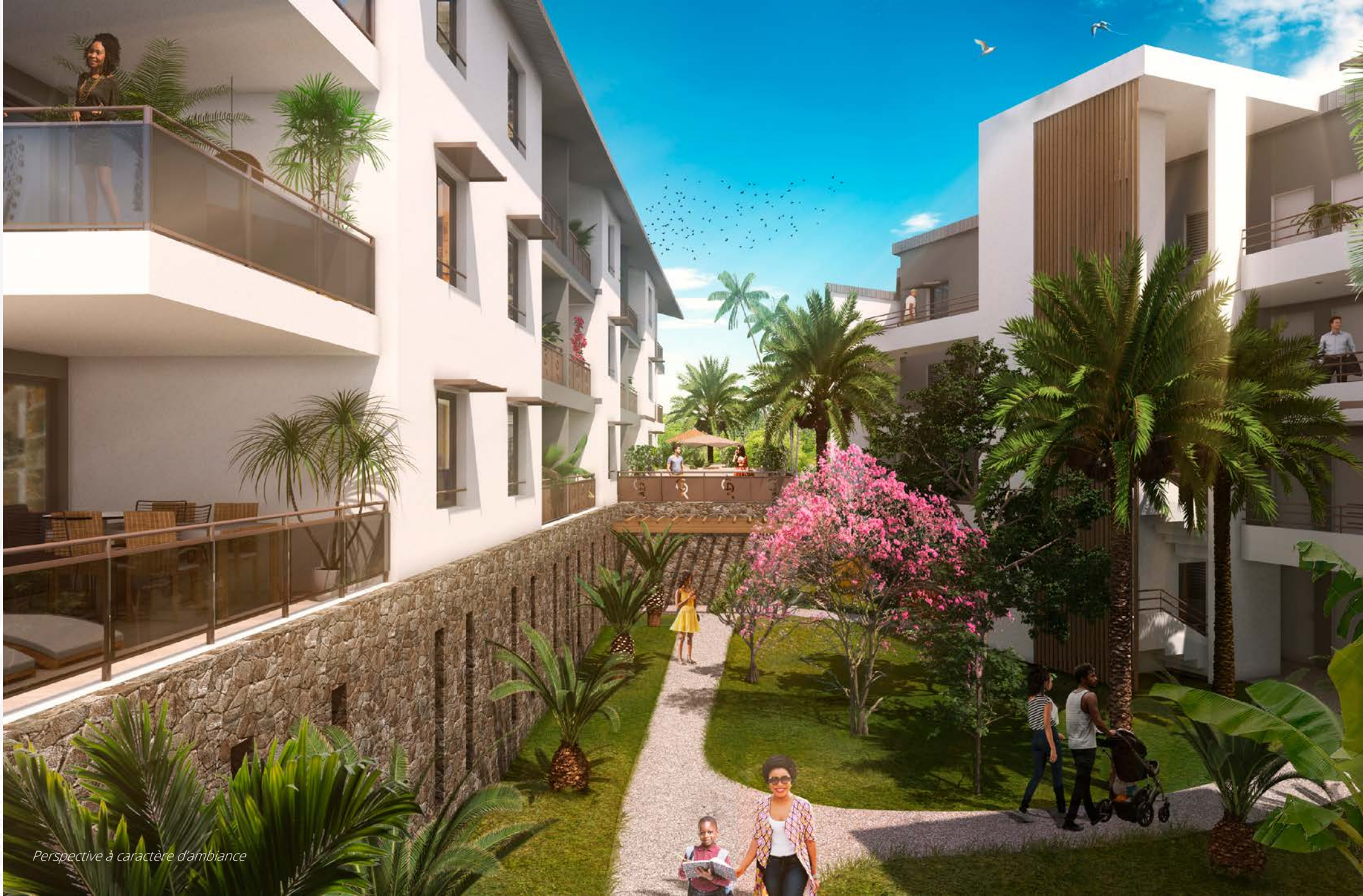
Perspective à caractère d'ambiance